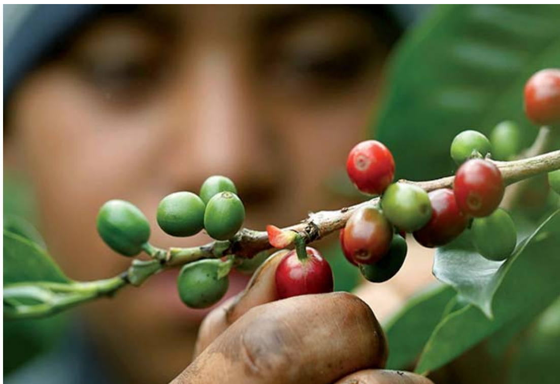
El café en Esuque y su importancia en el desarrollo de Venezuela.

La producción de bienes y la prestación de servicios es en la actualidad el principal motor económico de la localidad, además de la tradicional agricultura. A mediados del siglo XVII, se desarrollaron importantes áreas de cultivo de cacao destinado a la exportación, y más tarde varios terrenos se volcaron a producir café, el cual se convirtió rápidamente en el primer bien exportable de toda Venezuela. Debido al clima, los suelos idóneos y la existencia de grandes arboledas para proteger los cultivos en las laderas de las montañas para la producción cafetalera, Esuque logró un importante desarrollo que daría lugar a la denominada "Época de Oro".