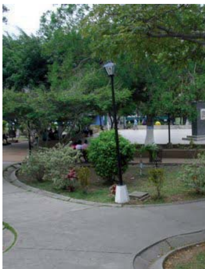
La plaza Bolívar, Escuque.

Con el crecimiento de los niveles de exportación de café, una gran cantidad de hacendados y comerciantes se radicaron en Escuque generando no sólo un crecimiento en el aspecto económico, sino que también los inmigrantes de otras regiones realizaron grandes aportes a la cultura. En pocos años, se habían fundado instituciones como el “Club Venezuela” o el “Glorias Patrias”, además de la “Banda de Escuque”, la cual llegaría a estar dirigida por José de Jesús Carreño. Los eventos sociales se sucedían en la Plaza Bolívar y en el teatro, que por aquel entonces se encontraba emplazado en un galpón con techos de palmas, y luego sería desmantelado para construir el Teatro Municipal, donde llegaron a presentarse numerosos recitales, conciertos y operetas. La difusión de ideas también había conseguido una gran expansión mediante la publicación de más de una docena de periódicos que circulaban por los ambientes más selectos de la ciudad.