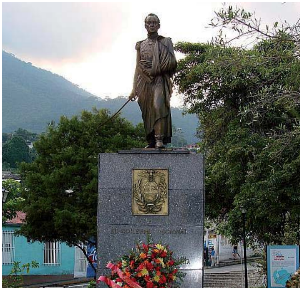
Estatua del Libertador en Escuque.