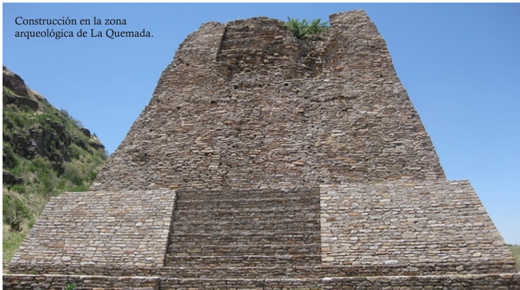
Construcción en la zona arqueológica de La Quemada.

Estas culturas mesoamericanas han dejado construcciones que hoy en día se las pueden ver en las zonas arqueológicas de La Quemada y Altavista.