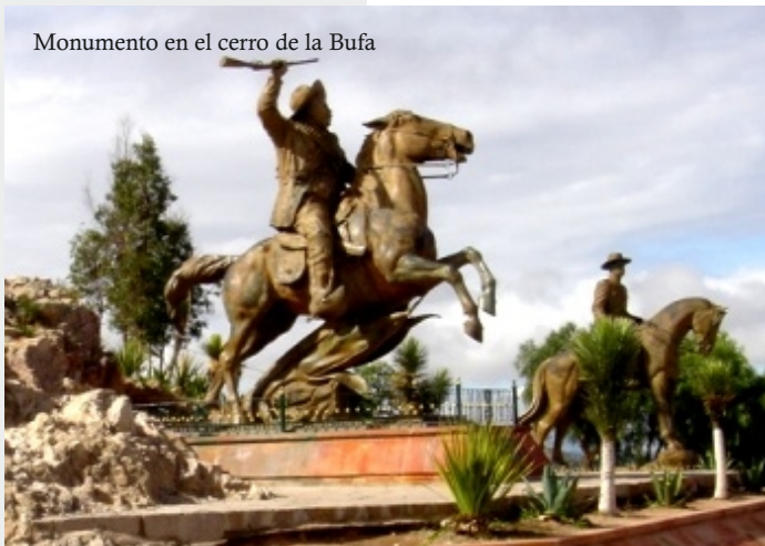
Monumento en el cerro de la Bufa