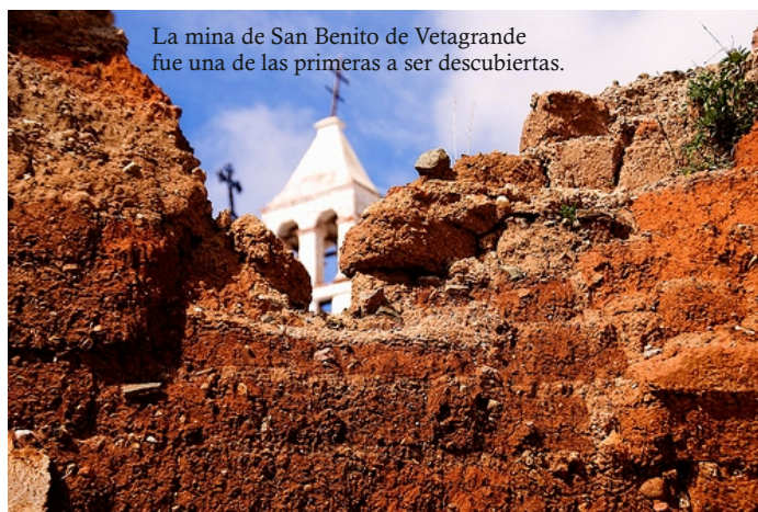
La mina de San Benito de Vetagrande fue una de las primeras a ser descubiertas.

El descubrimiento de las minas de Zacatecas fue el punto de partida para que se diera un fuerte flujo migratorio por lo que se dio una carencia muy grande de servicios públicos y se busco las formas de satisfacerlo. Además por todos los rumbos del estado se daba un fuerte movimiento de descubrimiento de minas y de fundación de poblaciones.