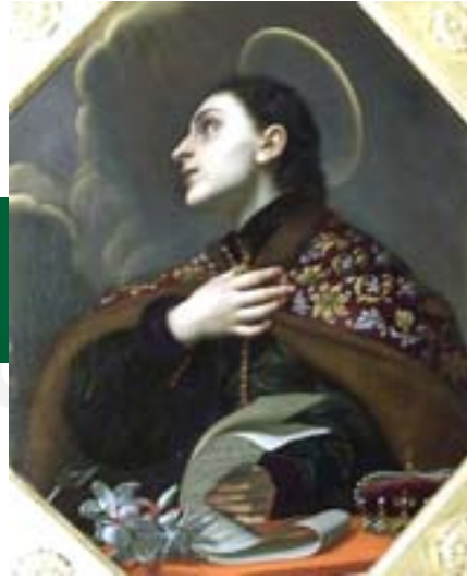
Imagen de San Casimiro.

En cuanto a la economía de este municipio, su base se encuentra en las actividades agroindustriales. Es así que los principales rubros agrícolas son las legumbres, el café, la caña de azúcar, la caraota, el maíz y algunos frutales. Cabe destacar que el café supo cumplir un rol muy importante para el municipio dado el alto nivel de calidad con el que se caracterizó. Fue por ello que el café obtuvo reconocimiento internacional, antes de que arribara a Venezuela la nueva base de la economía del lugar, la explotación petrolera. Por último, el municipio de San Casimiro también cuenta con actividad ganadera, especificándose en la cría de ganado y aves.