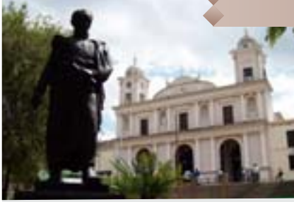
Iglesia de San Casimiro.

San Casimiro cuenta también con diversos lugares de interés para el turista. Entre estos sitios, es indispensable señalar a la Iglesia Matriz. La misma se encuentra frente a la visitada plaza Bolívar y fue construida en ladrillo, con la particularidad de estar pintada en colores claros y ser una construcción especialmente grande. Este bello templo tiene además tres naves y en su parte central puede observarse un podio hecho en mármol y rodeado de diferentes imágenes. Además de la Iglesia Matriz, el municipio de San Casimiro cuenta con diferentes edificios que datan de la época colonial como, por ejemplo, la actual Biblioteca Virtual de San Casimiro.