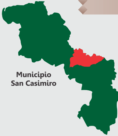
Municipio San Casimiro

La capital del municipio de San Casimiro lleva su mismo nombre y sus principales cualidades son sus calles elevadas y su ambiente colonial repleto de historia. La fundación de este municipio data del 6 de octubre de 1783, llevando el nombre original de San Casimiro de Güiripa. El Obispo Mariano Martí fue quien estuvo al frente de la fundación y se lo recuerda, a través de su Santo Patrono, San Casimiro, los días 4 de marzo. Para esta fecha, se ven en las calles distintas manifestaciones religiosas, como son las misas y la procesión llevando la imagen del santo patrono.