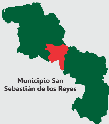
Municipio San Sebastián de los Reyes

El municipio de San Sebastián de los Reyes se ubica al norte de la zona sur del estado de Aragua. Su extensión es de aproximadamente 500 kilómetros cuadrados y se encuentra rodeado de montañas con un clima tropical de sabana predominante. Su fundación data del día 6 de enero de 1585 por Sebastián Díaz de Alfaro.