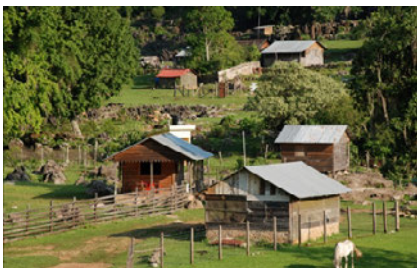
El Cielo - Tamaulipas

El Cielo también se caracteriza por poseer una gran variedad de flora y fauna. Dentro del primer grupo incluye al bosque tropical subcaducifolio, al bosque de coníferas, al bosque de pino, al encino, matorral xerófilo, la vegetación acuática y al bosque mesófilo de montaña. En la categoría de la fauna aparecen el oso negro, el linco, el jaguarundi, el tigrillo, la zorra gris, el venado