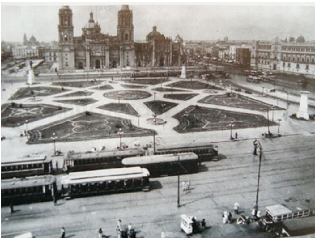
Centro histórico - Zócalo del Distrito Federal

En la época colonial México, precisamente lo que hoy conocemos como Distrito Federal se fue llenando de lujosas construcciones. La mayor parte de la población vivía, paradójicamente, en la miseria en los barrios de la periferia y los pueblos ribereños o montañeses. En tanto en el centro de la ciudad era motivo de constantes remodelaciones del Zócalo, la pavimentación de las calles, a costa de los viejos canales