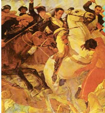
Arriba: Batalla de Junín. Centro: Francisco de Paula Santander.

Entre los años 1815 y 1816, Jacinto Lara se comprometió con los hechos de San Antonio de Apure y Mucuritas. Un año más tarde, en 1817 lo promovieron a General por sus actuaciones en las operaciones de la conquista de Guayana que estuvieron a cargo del General de Manuel Pilar. Una vez bajo el mando del Libertador formó parte de la Campaña Centro que se originó como consecuencia de la derrota de la batalla de La Hogaza el 2 de diciembre de 1817. En 1818 participó de los episodios de Pablo Morillo en Calabozo, junto con el general Francisco de Paula Santander logró vencer a Tolrá en Casanare en 1819 momento en el cual Jacinto Lara desempeñó el cargo de subjefe del Estado Mayor del Ejército Libertador. En su carrera militar estuvo al frente del Estado Mayor General como jefe y en 1821 se desempeñó como gobernador de Santa Marta y Cartagena de Indias.