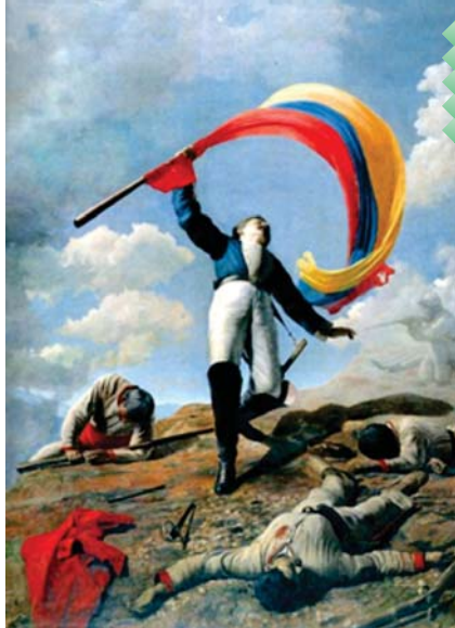
Muerte de Girardot en Bárbula.