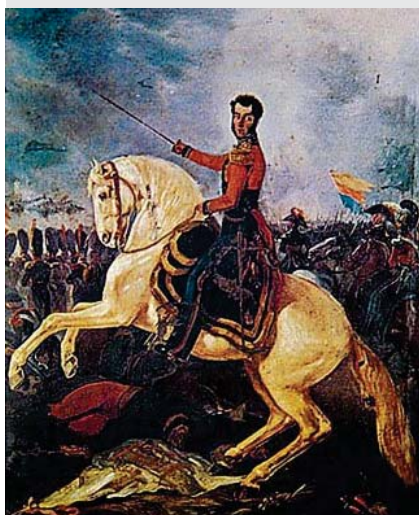
General Antonio José de Sucre.

En el año 1822 llegó a Perú siendo General de Brigada. Su objetivo era participar en la Campaña del Sur en conjunto con el General Manuel Valdés. Fue así que conformó la división colombiana auxiliar del Perú. Dos años más tarde se involucró en la Batalla de Junín y se dispuso al mando de Antonio José de Sucre. Luego de ese trabajo fue nuevamente ascendido como General de División de Retaguardia del Ejército. Al poco tiempo participó de la batalla de Corpahuaico que le convirtió en héroe al salvar a los batallones Rifles, Vencedor y Vargas.