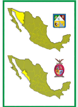
Sonora y Sinaloa desde 1831, luego de que se separaran definitivamente

Años más tarde, Estados Unidos comienza con un proyecto expansionista e invade México.