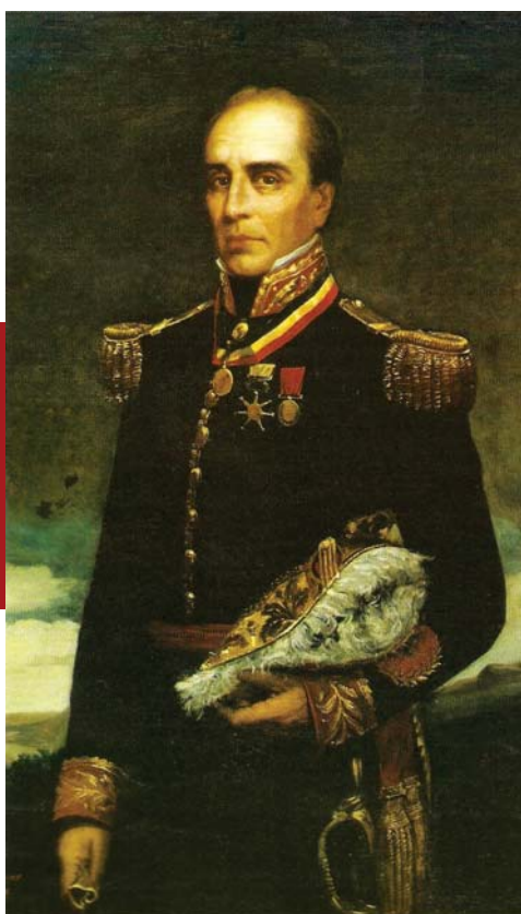
Centro: Rafael Urdaneta. Abajo: José Antonio Páez.

Intervino en 1816 en las acciones militares llevada a cabo en los Cocos y en Yagual. Un año más tarde, al mando de José Antonio Páez, dio lucha en la Batalla de Mucurita. También participó en los episodios de Achaguas y Calabozo.