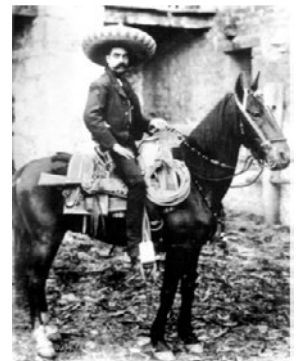
Adolfo de la Huerta

De acuerdo a todas las circunstancias injustas que vivían, los mineros del municipio de Cananea, Sonora se levantaron en el año 1906 dando inicio a la Revolución Mexicana.