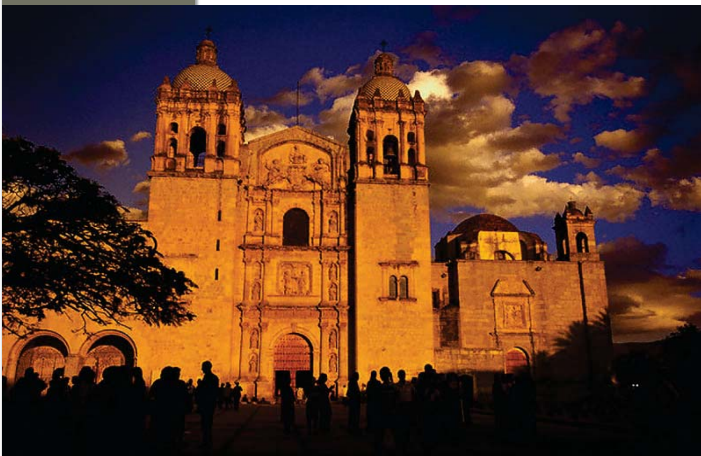
Catedral en el Estado de México

Este descenso se ve a su vez acompañado por un incremento poblacional que en el número de personas que no profesan ninguna religión o que han decidido adherirse a otras. En este sentido, los no religiosos han pasado de un 0.8% en 1970 al 1.8% de la población de cinco años y más en el 2000, lo que significa que 197 mil 693 habitantes no profesaban religión alguna. Otras religiones que se destacan son la protestante y la evangélica, entre ellas pentecostales, neopentecostales y la iglesia del dios vivo con 423 mil 68 adeptos, o la religión bíblica no evangélica, entre ellas, adventistas del séptimo día y testigos de Jehová, con 172 mil 313 creyentes.