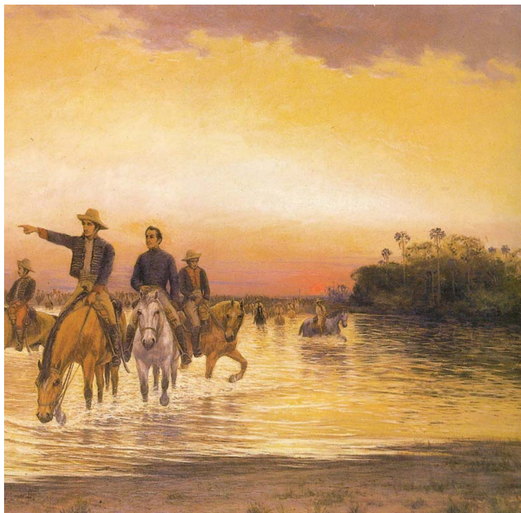
Marcha del Libertador Bolívar y Santander en la campaña de los Llanos.