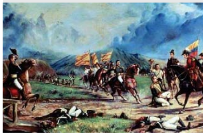
Batalla de Nueva Granada.

Logró ascender de posiciones a medida que se desempeñaba como militar. Su trabajo era admirable y por eso en el año 1816 lo nombran Capitán. Rápidamente, dos años más tarde llegó a ser Coronel y los pocos días fue nombrado miembro de la Orden del Libertador. En su carrera se pueden ver grandes logros es por eso que los reconocimientos le llegaron uno detrás del otro. Su compromiso con la nación lo convirtió en un prócer.