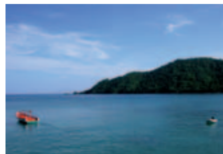
Puerto Frances, Estado Miranda, Venezuela.