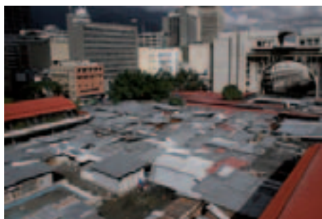
Plaza Diego Ibarra Venezuela.

Además, estos municipios concentran el 22 por ciento del territorio de Carabobo, abarcando una superficie de 961,18 km 2 , a la vez que no cuentan con contacto directo con la costa del Mar Caribe.