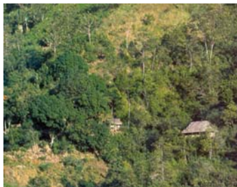
Región de Huancabamba