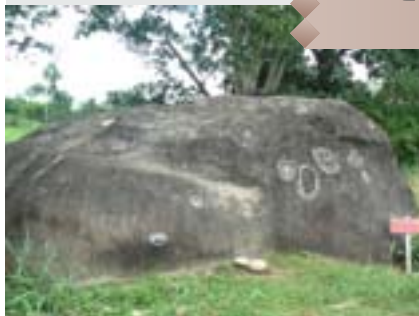
Arriba: Piedra El Indio, Municipio Sucre. Centro: Petroglifo de Santa Marta, Municipio Sucre.