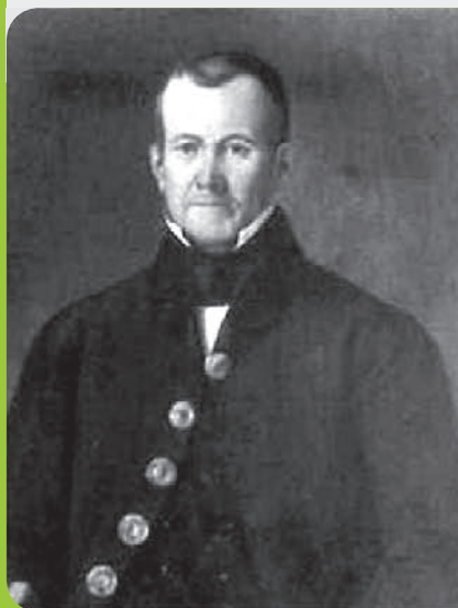
Esteban de Antuñano (26 de diciembre de 1792, Veracruz - 7 de marzo de 1847, Puebla)

Con la aplicación de las Leyes de Reforma en 1859 la biblioteca pasa a poder del Estado y los conventos fueron clausurados. Los ministros de plenipotenciales de Inglaterra, España y Francia firman los tratados de la Soledad y de esta manera se retiran las tropas de México. Aunque no todas se van: las francesas terminaron avanzando al interior del país el 27 de abril de 1862.