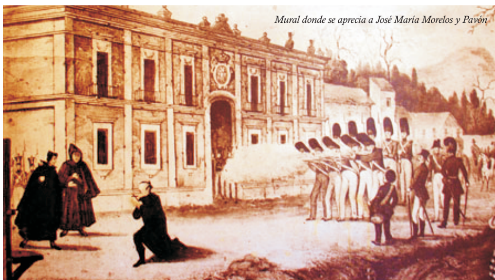
Mural donde se aprecia a José María Morelos y Pavón