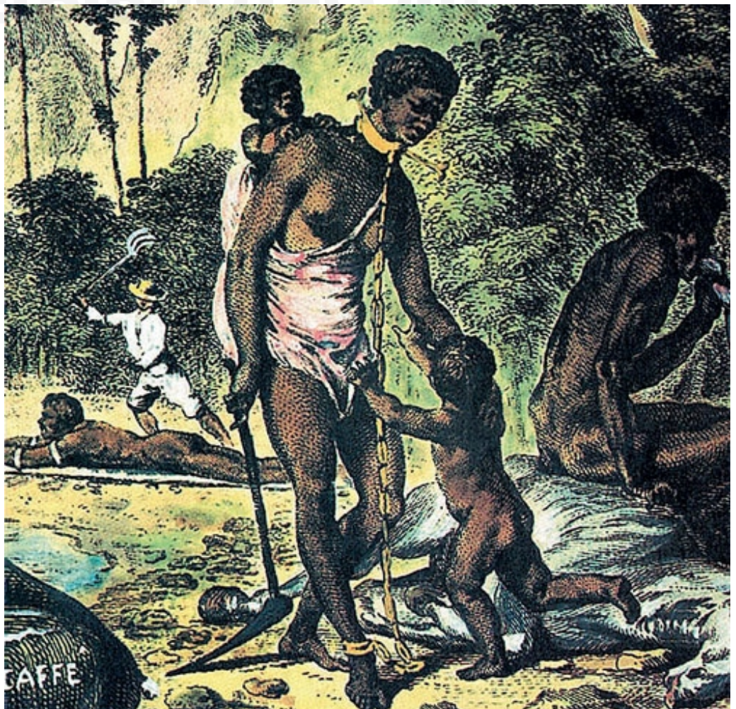
Antiguo Grabado que muestra la esclavitud de los negros

Durante la época colonial sólo se comerció exclusivamente con Europa a través del puerto de Veracruz.