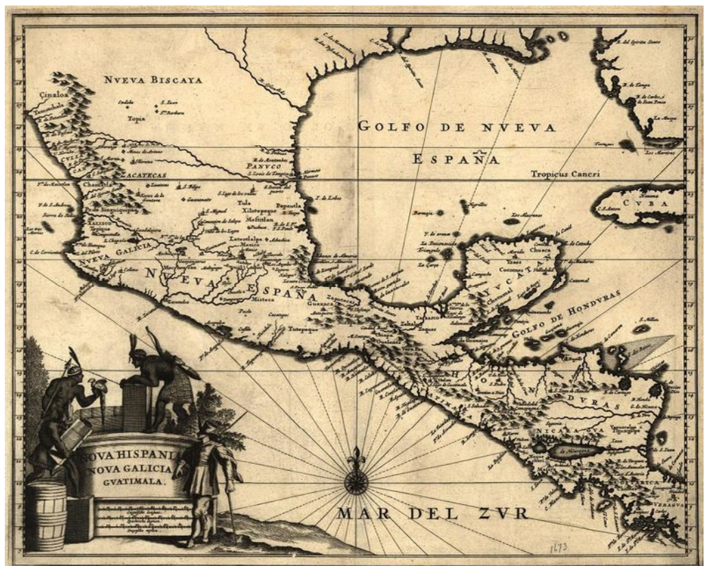
Antiguo Mapa de Nueva España

Los ingleses mantenían una relación comercial con Nueva España.