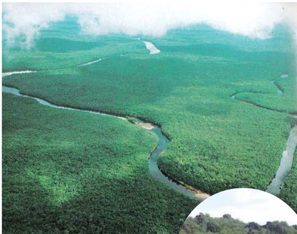
Río Imataca. En círculo: río Sipapo.

En la región de Upata se concentra la mayor cantidad de la industria maderera, aunque en los últimos años se ha reorganizado esta actividad con la creación de numerosos parques forestales: