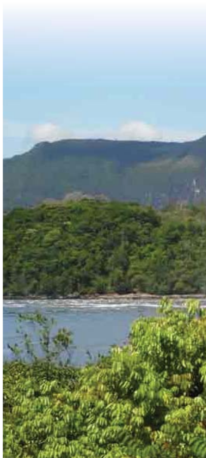
Arriba: Río Paragua. Derecha: Cuenca del río Caura.

-La Paragua: con casi 800.000 hectáreas de extensión.