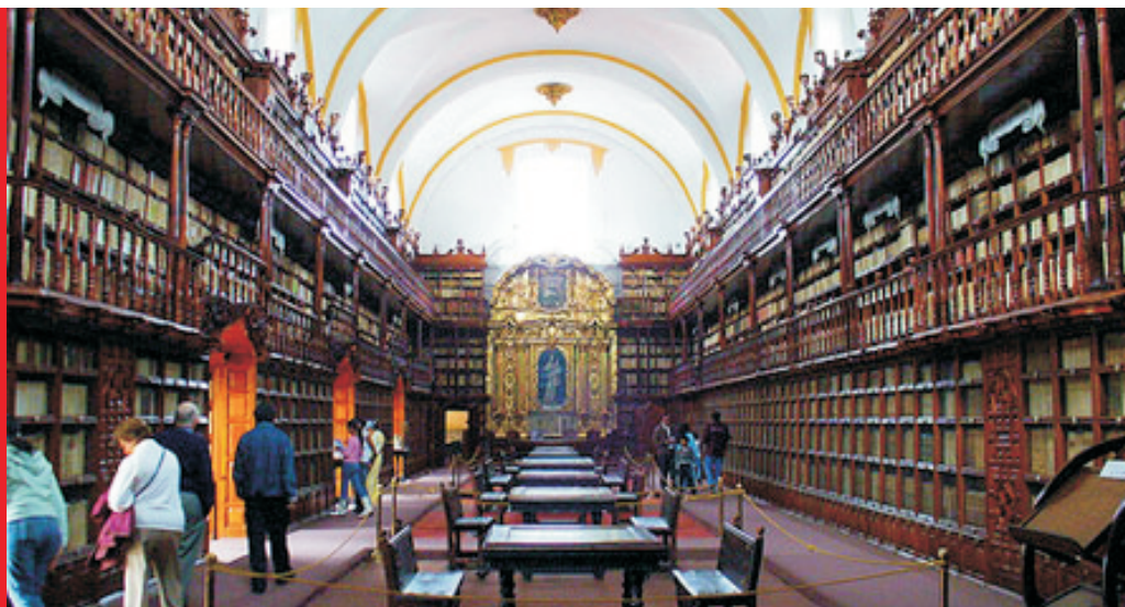
Biblioteca Palafoxiana. Espacio dedicado a la cultura y lectura, la cual abre sus puertas a los turistas para que puedan deleitarse con la disposición y acervo abierto a la consulta de todo aquel que así lo desee.

Economista, industrial y empresario poblano que fundó la primera fábrica de hilados y tejidos de algodón mecanizada que funcionó en México, con lo que dio origen a la moderna industria textil del país, introduciendo los métodos y las máquinas hidráulicas inventadas por Richard Arkwright. Fue un verdadero ideólogo y precursor del liberalismo industrial.