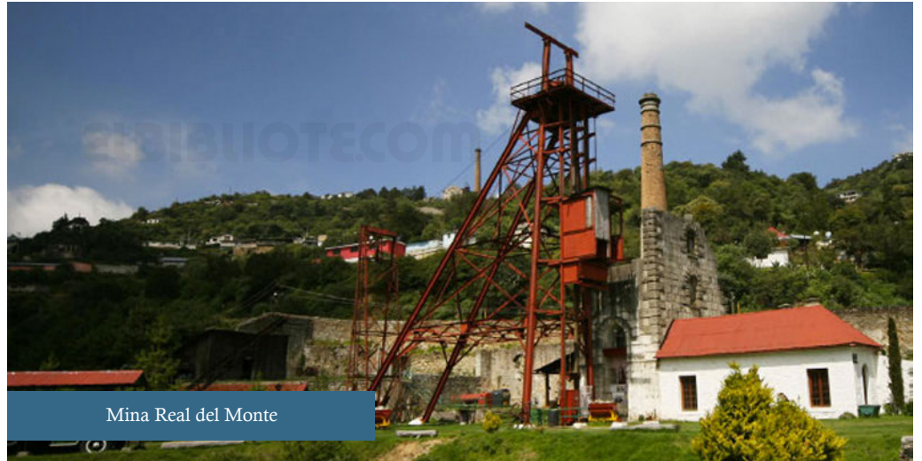
Mina Real del Monte

Hacia 1766 Terreros pretendió suprimir el partido y los jornales que pagaba y aumentar al doble las cargas de trabajo, lo cual llevó a que el 15 de agosto los mineros de Real del Monte se lanzaran a la huelga trasladándose a la ciudad de Pachuca de Soto para manifestarse. Este es uno de los primeros antecedentes de los movimientos huelguistas de México. Para el año 1807 en Tulancingo, se encarceló bajo las órdenes de la autoridad española al gobernador indígena y a sus oficiales debido a que se negaron a pagar un impuesto extra para reparar la iglesia.