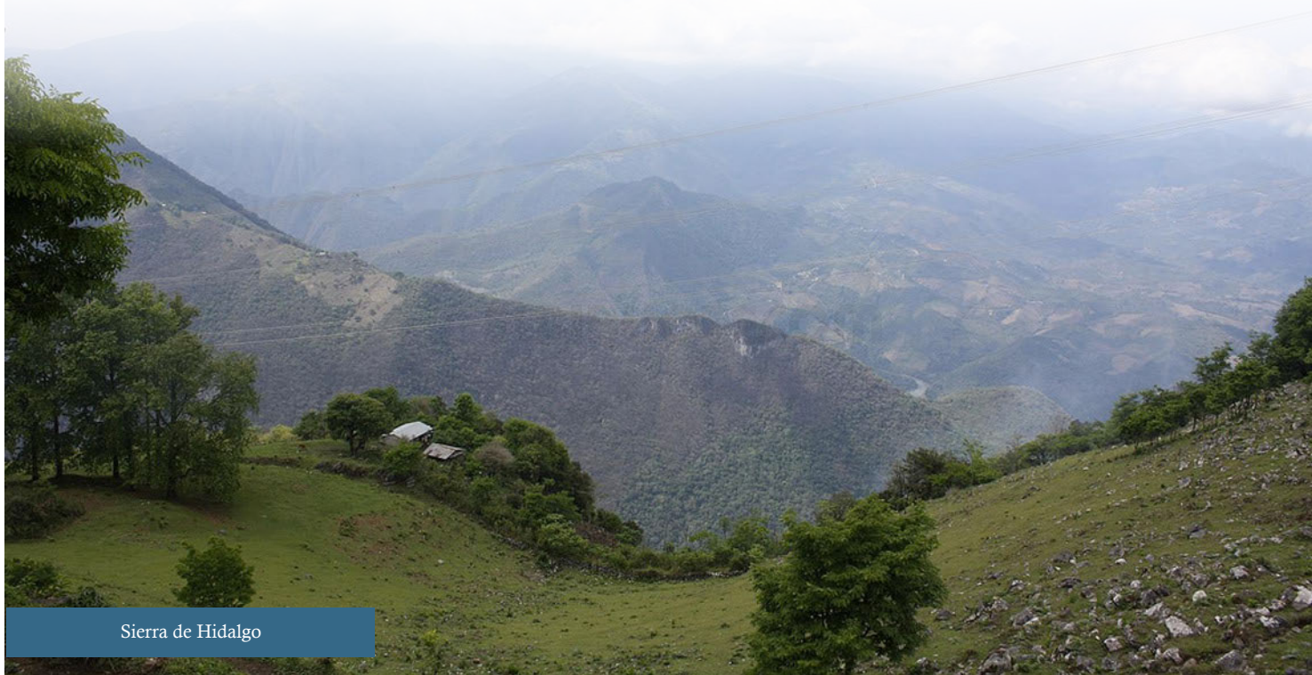
Sierra de Hidalgo