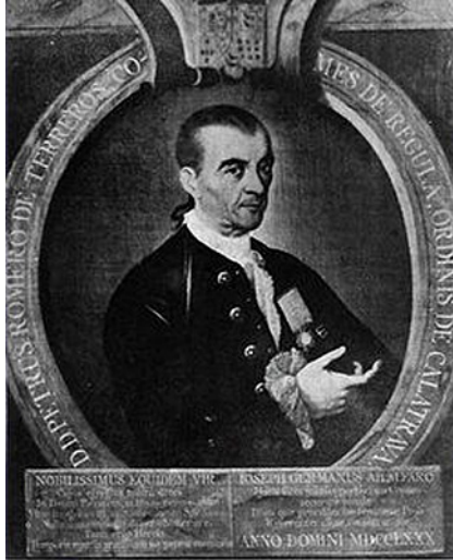
Conde Pedro Romero de Terreros