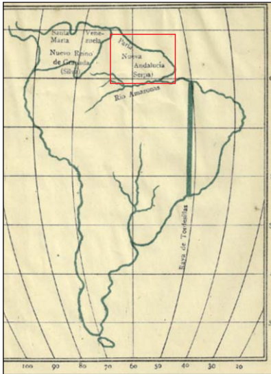
Paria y La Nueva Andalucía.

Mientras transcurrían estos sucesos, Sedeno organizó una nueva expedición y se dirigió nuevamente a Paria, donde fue reconocido por Delgado y la guarnición que había dejado Ordaz. Embarcóse para Trinidad, meta de su expedición y dejó en la fortaleza de Paria a Juan de Sosa y una pequeña guarnición.