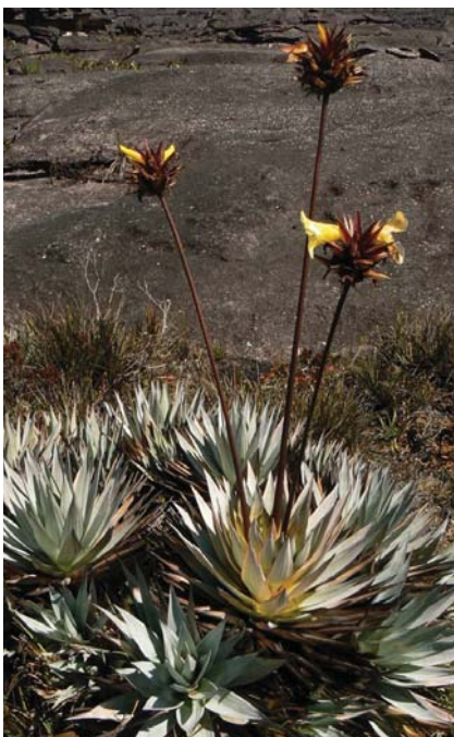
La Orectanthes (arriba) y la Roraimae (derecha) son dos de las especies que se encuentran en este Parque nacional.

La flora, en tanto, contiene una gran cantidad de especies, muchas de las cuales son endémicas. Entre las más destacables, pueden mencionarse la Orectanthes, Bonettia, Roraimae, Bochina, Eliamphoras, Brochina, Micrantha, Bonettias, Droseras, Stegolepis Guyanensis, Euterpes, Clusias, Thibaudias, Reducta, entre otras.