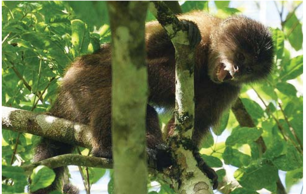
Derecha: Monos pertenecientes a la fauna característica de lugar. En círculo: ejemplar de aves del parque.

La fauna en el parque nacional es diversa, encontrándose desde osos hormigueros, jaguares y zorros hasta nutrias gigantes y monos. Además, existen águilas, halcones, guacamayas y colibríes. Además, pueden hallarse ejemplares de ardillas Guayanesas, pumas, venados, perezas de tres dedos, comadreas, ratones, tigres y cunagueros, reptiles como el camaleón la iguana, morrocoy selvático, serpientes como la falsa coral, Bejucas, anacondas, falsas mapanares, y venenosas como la coral, mapanare, cuaima piña y cascabel. Además, pueden hallarse diversas especies de ranas y sapos, entre otros ejemplares.