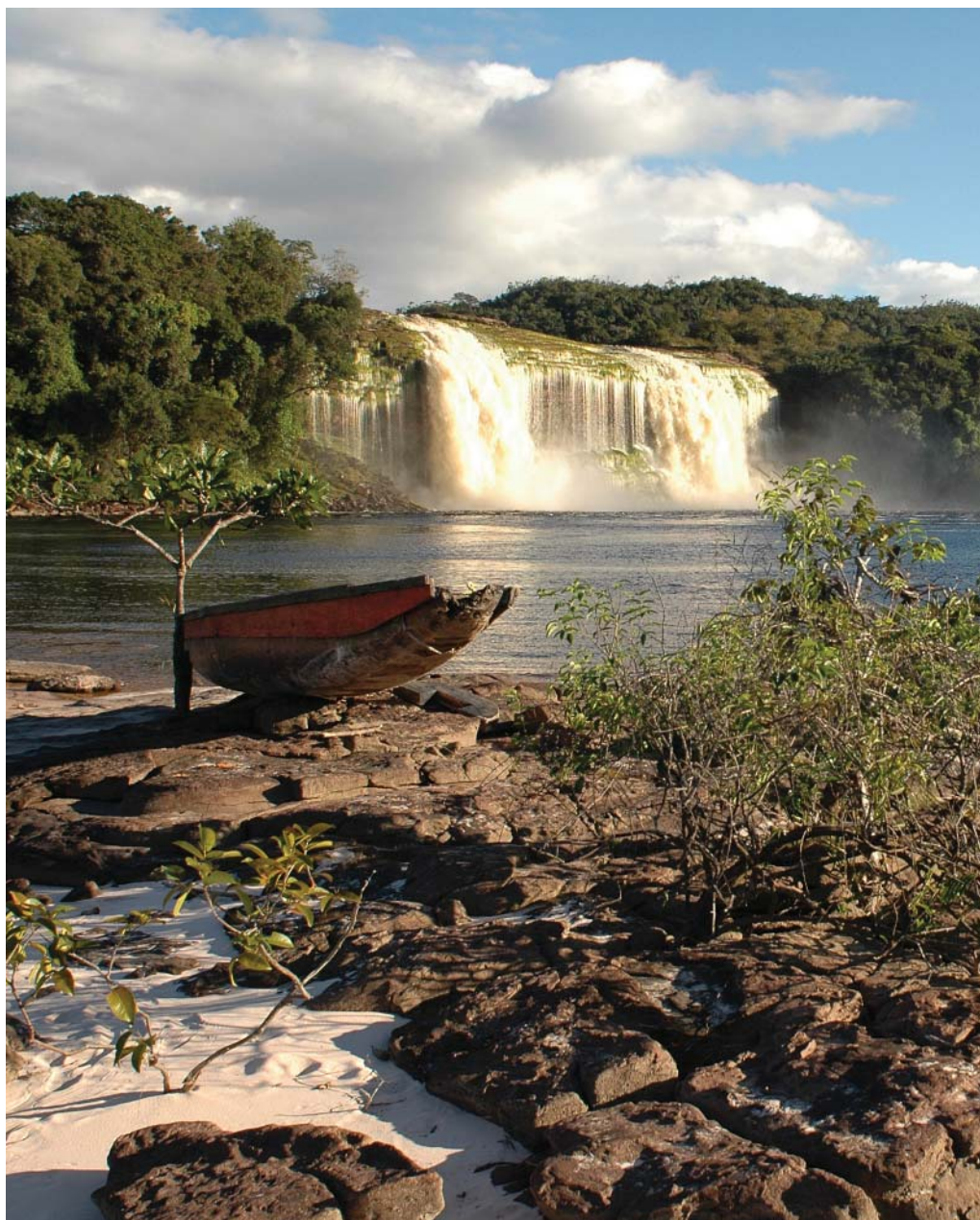
Parque Nacional Canaima.

El Canaima se encuentra atravesado por la parte superior del río Caroní, además de las aguas del Surukun, el Aponwao, el Yuruaní, el Carraio y el Kukenán.