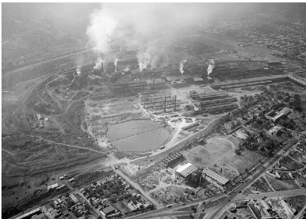
Compañía Fundidora de Hierro y Acero de Monterrey.