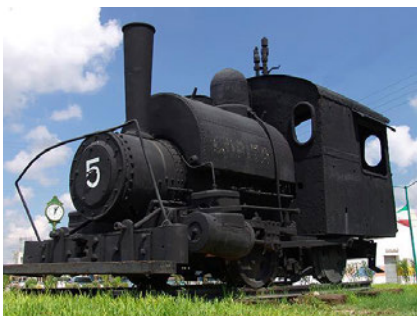
Antigua máquina ferroviaria de Coahuila.

Las ricas minas atrajeron al capital extranjero. La casa fundada por el británico Guillermo Purcell en Saltillo se mostró muy activa en Sierra Mojada.