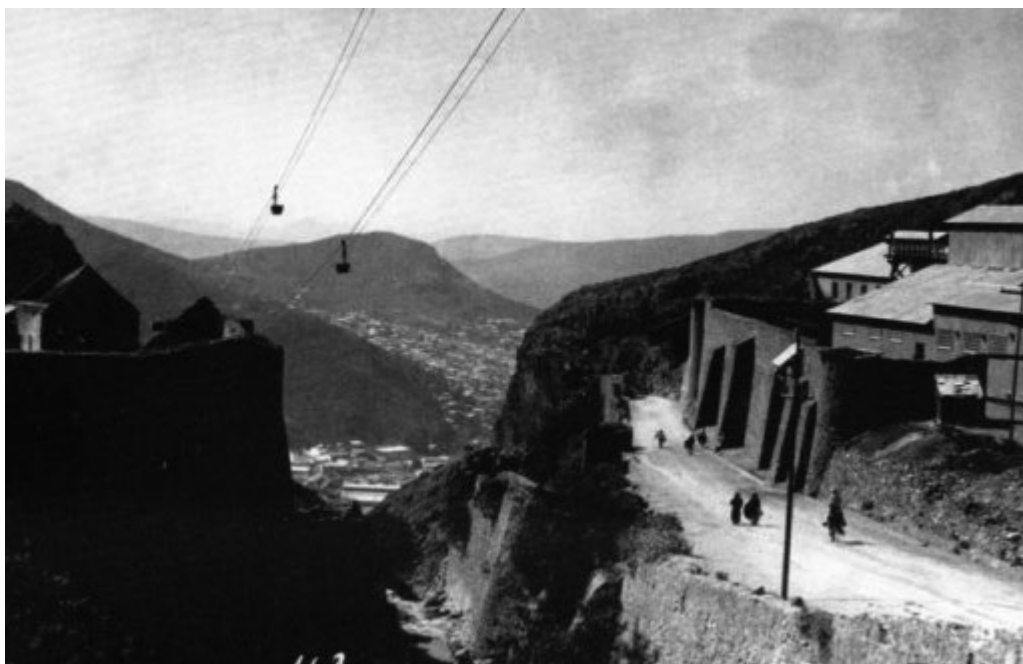
Sistema teleférico para transportar el mineral.

Coahuila recuperó la posesión de esa porción de su territorio después de una larga disputa. Sin embargo, hay que mencionar que la riqueza de las minas duró poco.