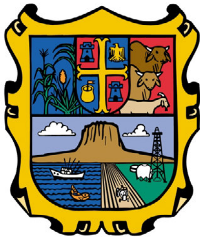
Escudo - Tamaulipas

autores que adhieren a esta posición dividen el nombre de la siguiente forma: TAM-A-HOL-I-PAM: ol, rezar, tam, tercio, monto o mucho: "lugar donde se reza mucho".