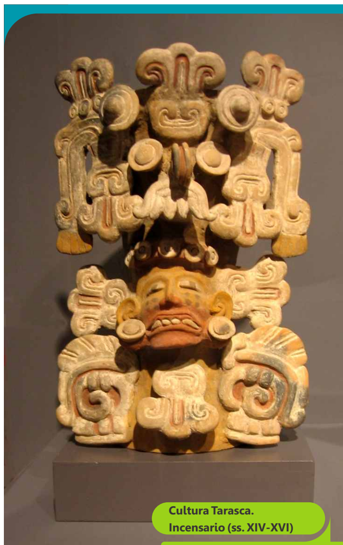
Cultura Tarasca. Incensario (ss. XIV-XVI)

Nuño de Guzmán de la Tenochtitlán, partió a fines de diciembre de 1529 con el objetivo de comandar a 300 españoles que aún no habían encontrado la fortuna anhelada, además de siete u ocho mil indios bien provistos de bastimento y que acarreaban 12 piezas de artillería ligera.