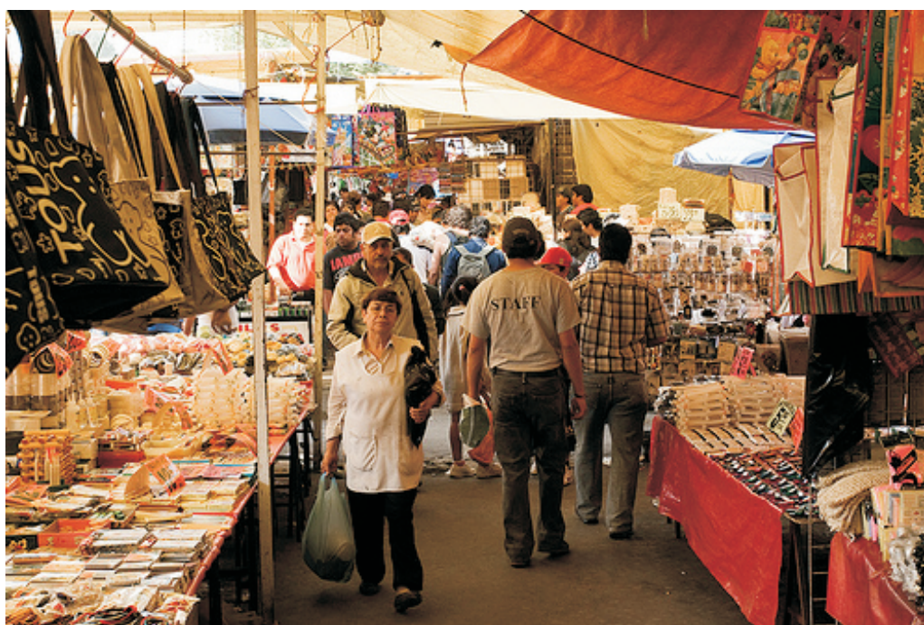
Mercado de La Merced, DF

El mercado de flores más grande de Latinoamérica; tiene una extensión de 13 hectáreas. Forma parte de un área del rescate Ecológico y es el principal centro de acopio de plantas actualmente.