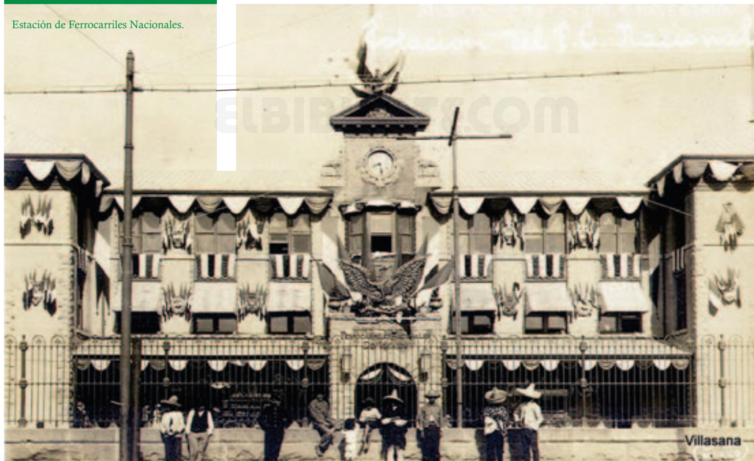
Estación de Ferrocarriles Nacionales.

En Santiago de Querétaro, se terminaron de ejecutar las diversas modificaciones y adiciones al plano urbano, que se habían iniciado a mediados del siglo XIX. En 1902 se realizó el tendido de las vías de los Ferrocarriles Nacionales y, en 1910, las del Ferrocarril Acámbaro-Querétaro.