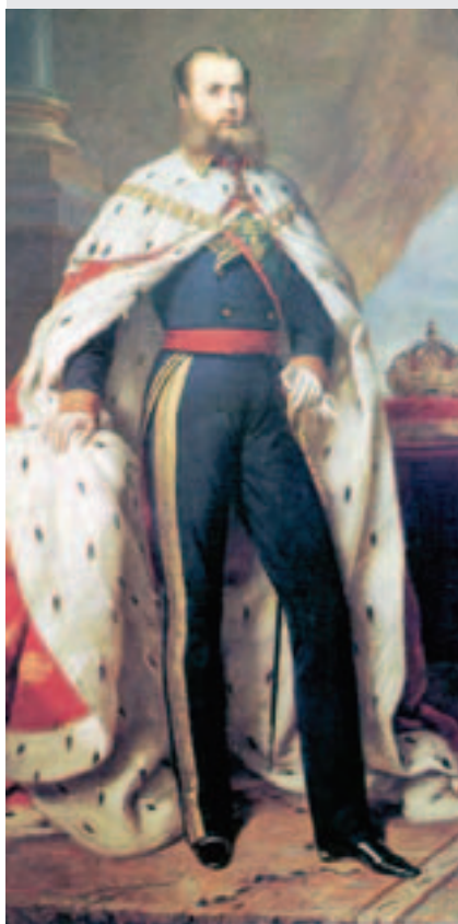
Maximiliano de Habsburgo

Sin embargo, el ejército republicano nunca detuvo su marcha contra el Imperio. Por este motivo es que el emperador debió abandonar su lugar de asentamiento, en la ciudad de México, y dirigirse a Querétaro, que representaba último sitio ocupado por las tropas imperialistas, desde 1863.