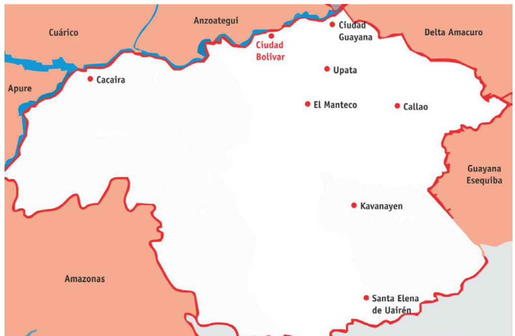
Estado de Bolívar y sus principales ciudades.

La población del estado Bolívar representa el 5,26% del total del país, la cual se distribuye principalmente en Ciudad Bolívar, Ciudad Guayana (Puerto Ordaz), Upata, Caicara del Orinoco, Tumeremo, Guasipati, El Callao y Santa Elena de Uairén.