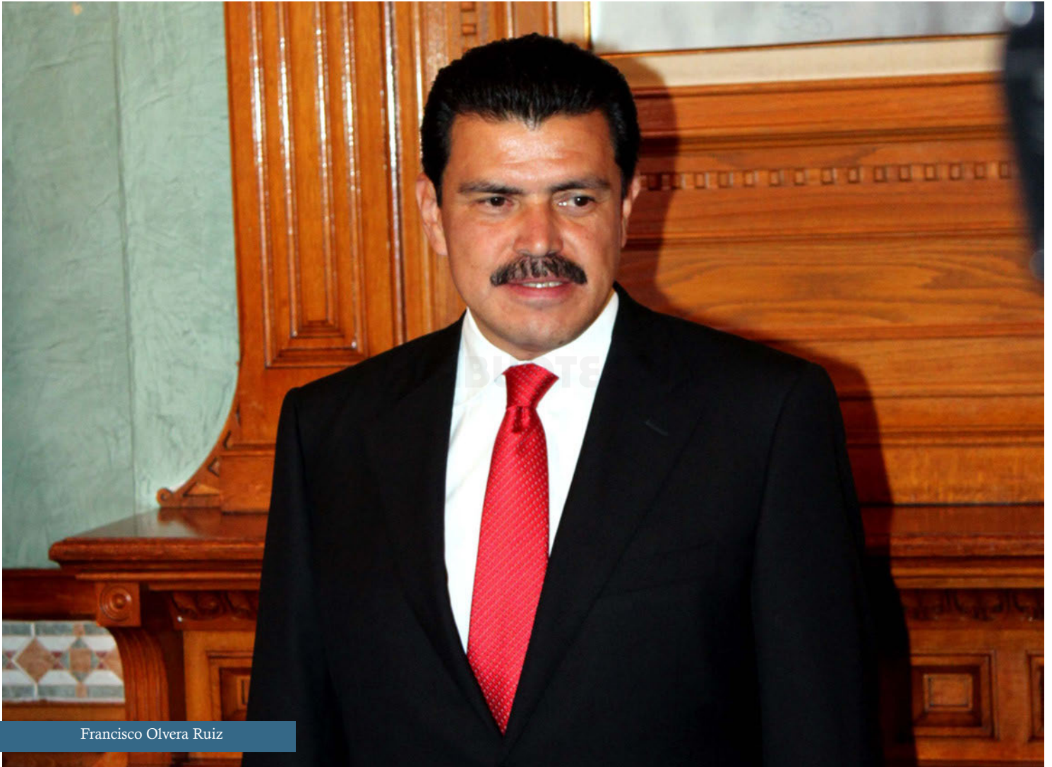
Francisco Olvera Ruiz

El 4 de julio de 2010 se llevaron a cabo elecciones estatales donde Francisco Olvera Ruiz resultó el gobernador electo.