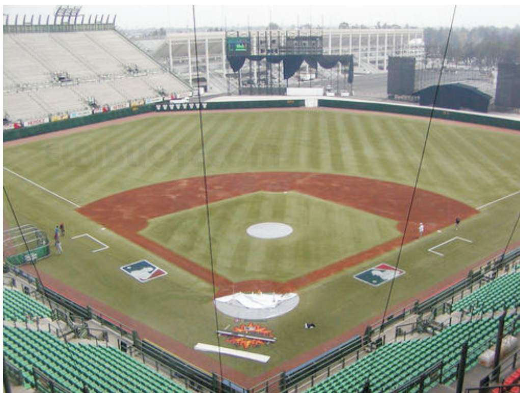
Estadio mexicano FORO SOL

El Foro Sol es recinto destinado inicialmente para la realización de conciertos masivos, aunque actualmente también se usa para otro tipo de eventos. Se encuentra dentro de la Ciudad Deportiva de la Magdalena Mixhuca, en la Ciudad de México. En 1993 en la curva del Autódromo