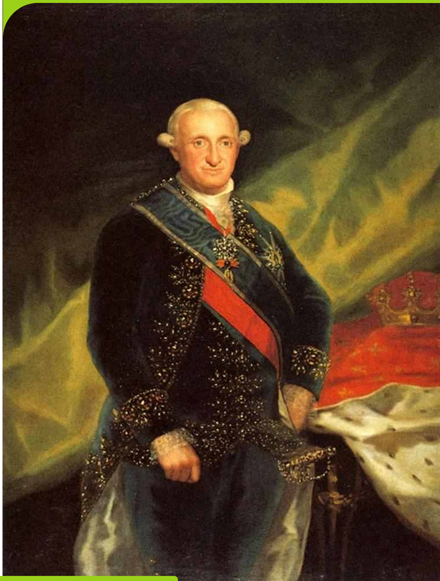
Francisco de Goya - Retrato de Carlos IV

Por este motivo José I, hermano de Napoleón, estaba visto como el rey ilegítimo. En España se desató una serie de oposiciones que involucraban el movimiento juntista y la guerra de la independencia española ante Francia.