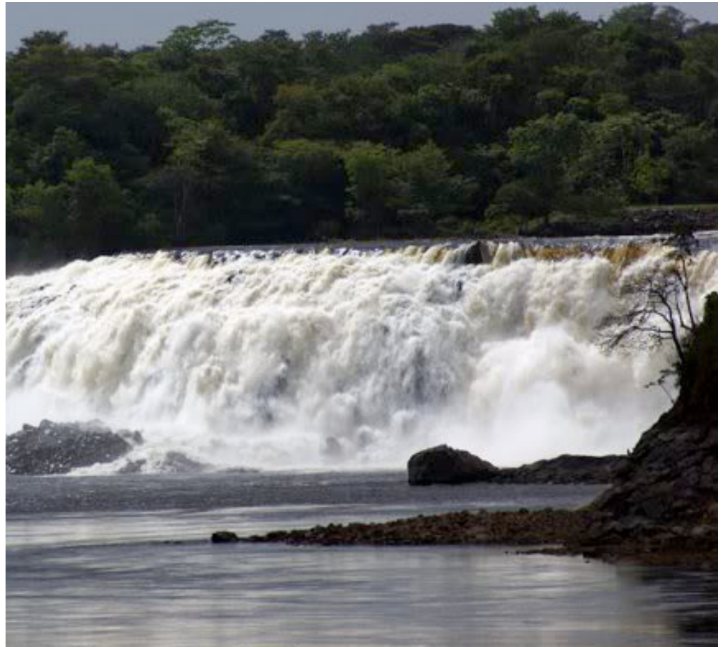
Parque de la Llovizna: ubicado en el centro de una de las ciudades más Bellas de Venezuela (Pto Ordaz). Abajo: Vista panorámica de la ciudad.

Finalmente, a finales de 1979 aparecería por primera vez de manera legal la denominación de Ciudad Guayana dentro de los territorios del estado Bolívar.