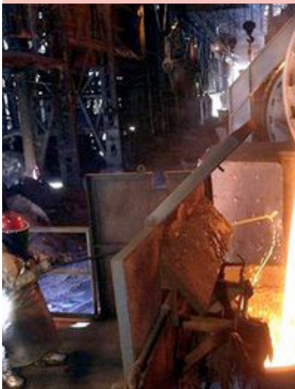
Arriba: Ciudad Guayana. Derecha: Represa de Macagua. Abajo: empresa Sidor.

Su producción de energía eléctrica es de gran importancia, tanto para la ciudad, como para el estado y el país, ya que sus represas Macagua y Guri aportan más de %65 del consumo de toda Venezuela.