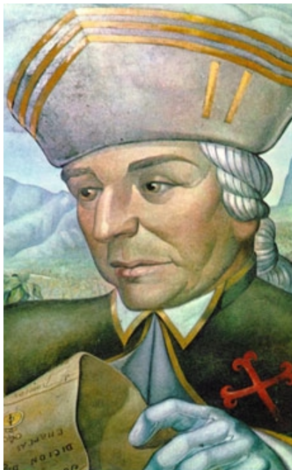
José de Escandón

Un siglo después, Tampico continúa siendo la sede de diferentes iniciativas para el desarrollo de la región. Entre ellas aparecen fundamentalmente la primera aerolínea mexicana en empezar con sus operaciones, llamada Mexicana de Aviación, que aún continúa funcionando, y la primera embotelladora de refrescos del país, la embotelladora de Coca Cola, también aún activa.