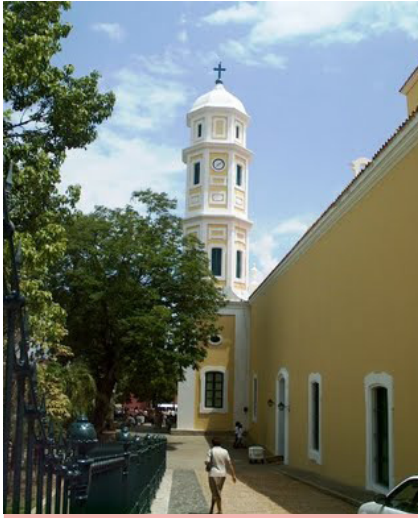
Caicara del Orinoco es la capital de la parroquia sección capital Cedeño y a la vez también es la capital del municipio Cedeño, del estado Bolívar.