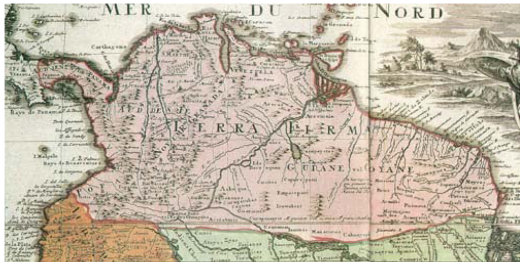
Mapa de Provincia y Gobernación de Trinidad y Guayana

En la segunda década del siglo XIX, el territorio comenzó a formar parte del Departamento de Orinoco de la República de Colombia, conformado por Guayana, Barinas y Apure.