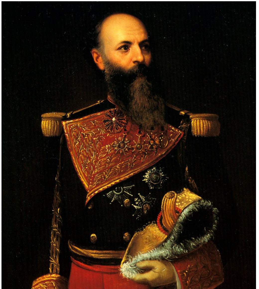
Antonio Guzmán-Blanco (Caracas, 28 de febrero de 1829 - París, Francia, 28 de julio de 1899) fue un militar, estadista, caudillo, diplomático, abogado y político venezolano, partícipe y general durante la Guerra Federal y presidente del país en tres ocasiones (1870 - 1877, 1879 - 1884, y 1886 - 1887).

Cuando Guzmán Blanco asumió el poder, parte de los territorios del estado Bolívar constituyeron las regiones de Caura y de Yuruari, y más tarde se separaría también la porción del Delta.