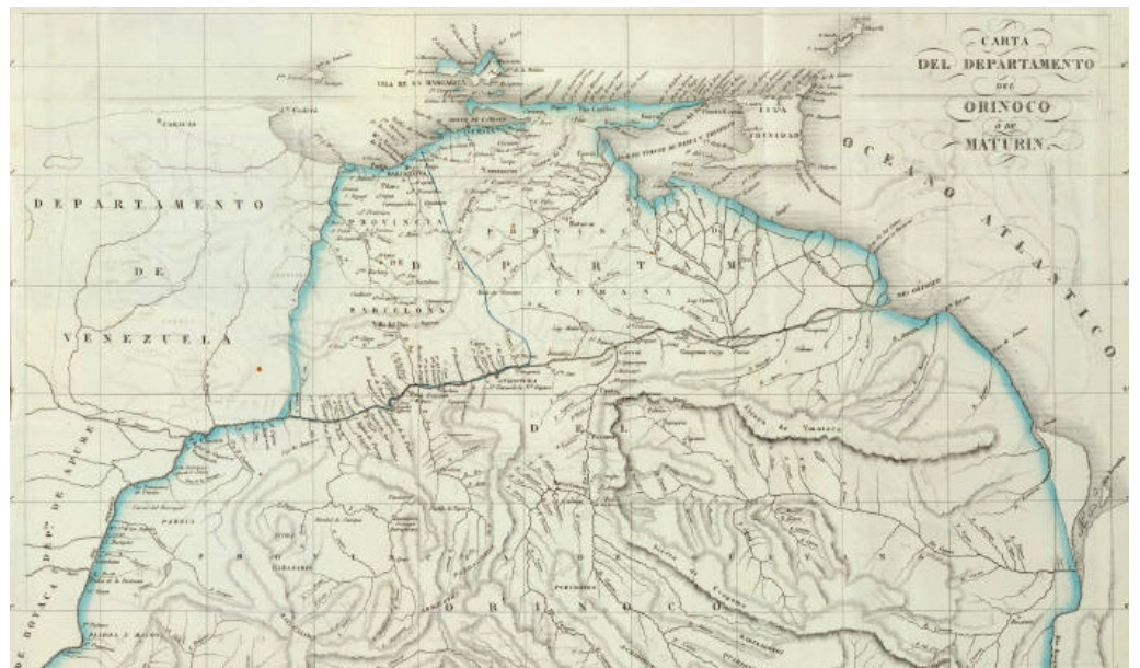
Carta del Departamento del Orinoco en 1827.

En la segunda década del siglo XIX, el territorio comenzó a formar parte del Departamento de Orinoco de la República de Colombia, conformado por Guayana, Barinas y Apure.