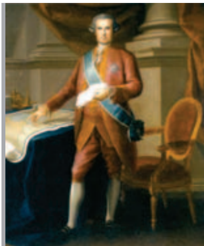
José de Gálvez 1720-1787

La primera Constitución Política del Estado de San Luis