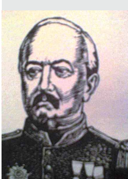
El mariscal Bazaine

Una nueva intervención militar debió sufrir la ajetreada zona de Jalisco, cuando Francia, España e Inglaterra acordaron el 31 de octubre de 1861 intervenir República Mexicana, en virtud de la suspensión de pagos ordenada por el presidente Juárez.