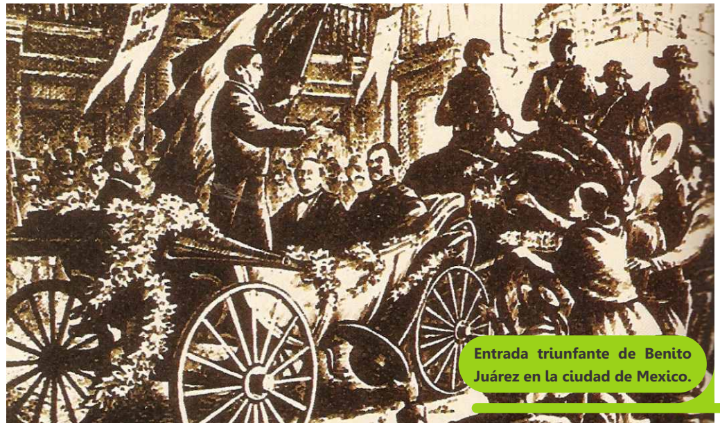
Entrada triunfante de Benito Juárez en la ciudad de México.

Hacia 1871, la Legislatura se mostró fuerte constitucionalmente para regularizar sus funciones.