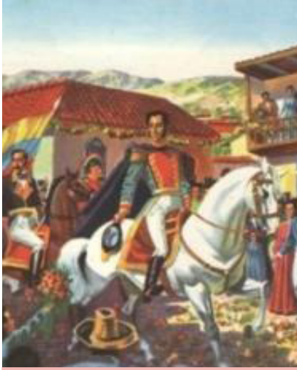
Simón Bolívar en la campaña Admirable.

Luego de incursionar con sus tropas por Nueva Granada, con voluntarios simpatizantes de la causa independentista, Bolívar se ve decidido a ingresar a Venezuela, dando inicio a la Campaña Admirable. Su decisión lo llevaría a poder tomar la ciudad de Caracas en unos pocos meses, demostrando su capacidad estratégica y de liderazgo en los campos de batalla. Ya en la capital venezolana, sería proclamado Libertador y recibido con honores. Sin embargo, no llegaría a reclutar los voluntarios suficientes para resistir una próxima embestida realista, la cual llegaría al poco tiempo, obligando a Bolívar a abandonar la ciudad y a dirigirse primero a Bogotá y luego a Jamaica, para terminar finalmente en Haití.