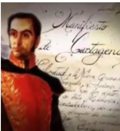
Bolívar se refugia en Cartagena, donde resistían los independentistas neogranadinos. Allí, traza un plan para recuperar Venezuela desde Nueva Granada (Colombia).

Por el fracaso inicial de su expedición, éste se dirige hacia Cartagena donde, desde Nueva Granada, difunde lo que sería conocido como el Manifiesto de Cartagena, en el cual apoyaba la constitución de estados republicanos en esa región del continente americano. En ese mismo escrito, Bolívar apoya la creación de una gran confederación de estados, bajo las directivas de un gobierno fuerte y decidido para intentar evadir cualquier intento separatista o una invasión desde el extranjero.