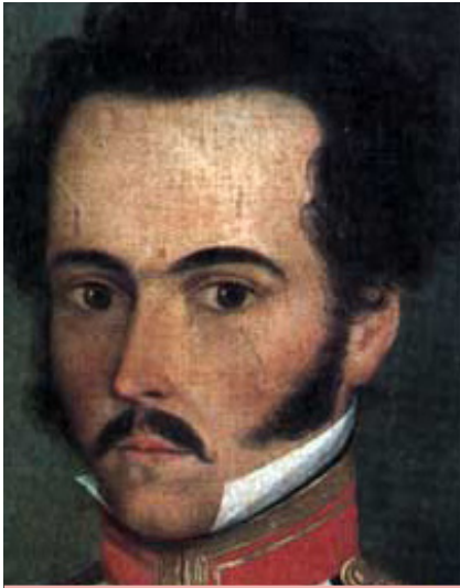
Arriba: Retrato de Simón Bolívar en 1812 Derecha: Litografía del prócer.

Una vez finalizada su etapa académica, Simón Bolívar retornó a Venezuela en 1807, donde comprende la necesidad de comenzar a gestar un movimiento independentista que logre desalojar a la corona española del poder.