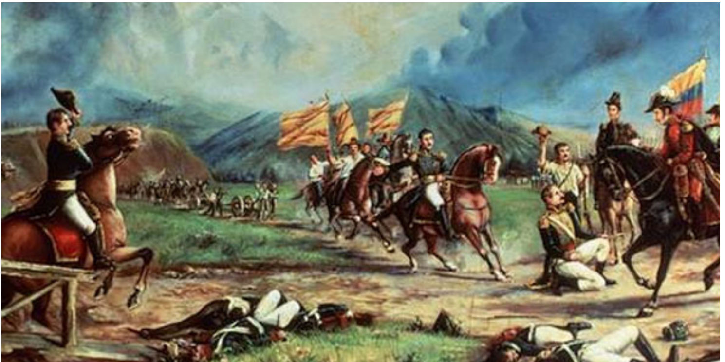
El Libertador instala el Congreso de Angostura. Allí nació Colombia. La fecha del 15 de febrero de 1819 marca el momento en que comenzó a gestarse la vida de una patria libre.

Una vez retornado a Venezuela, logra instalar una capital provisional del gobierno independentista en Guayana, luego de haber obtenido resultados exitosos frente a los realistas en varios campos de batalla. Desde allí convocaría al Congreso de Angostura, en 1819, donde consiguió un importante apoyo para su empresa.