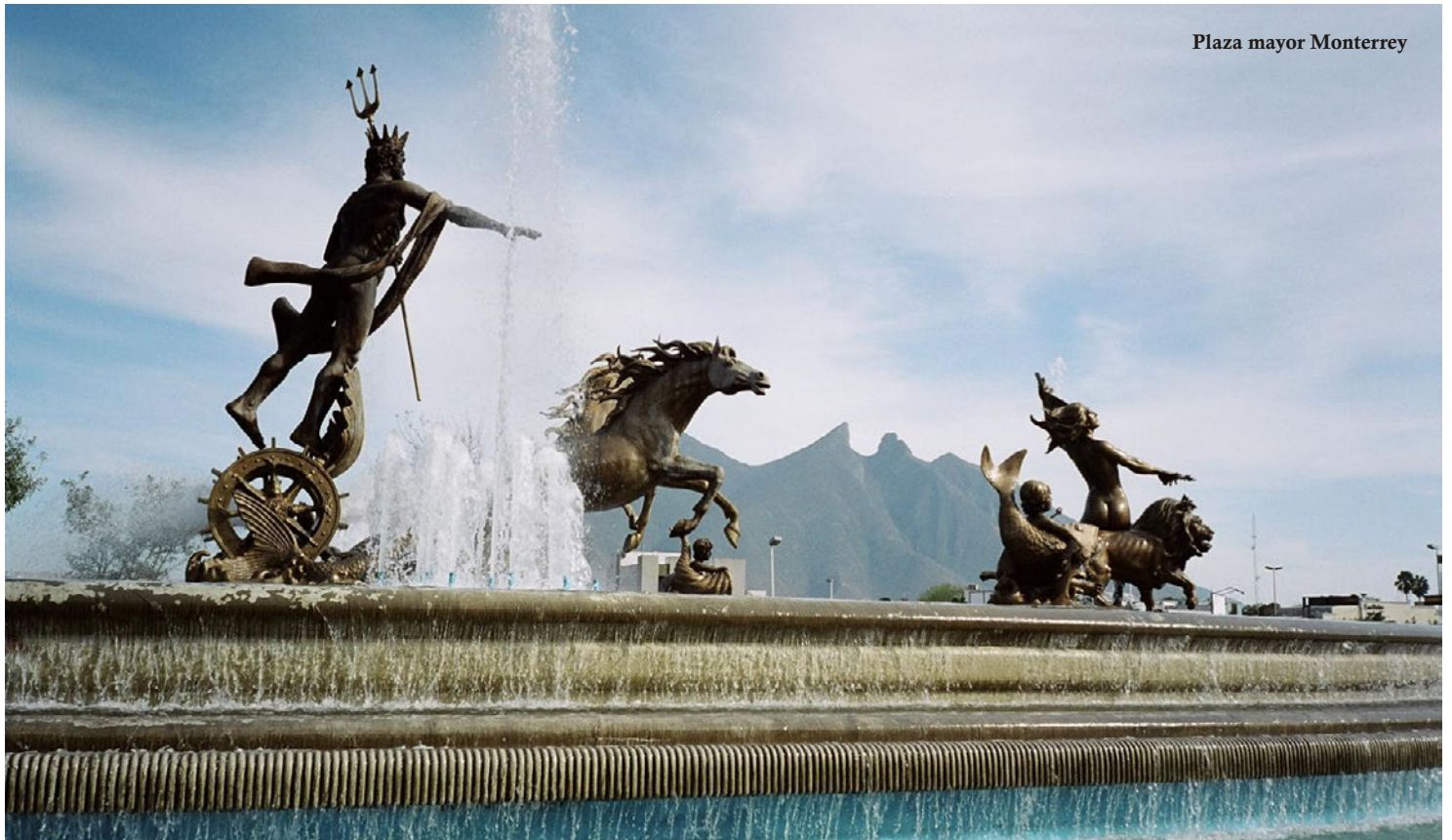
Plaza mayor Monterrey