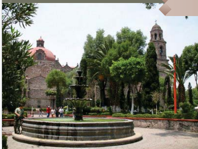
Fuente de Tlalnepantla