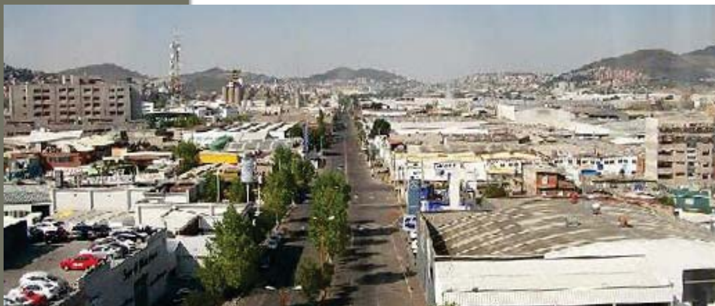
Vista general de la ciudad

Como ya se ha observado, la economía del municipio de Tlalnepantla a nivel interno es fundamentalmente industrial, lo que representa a un 70% de la actividad económica. Las otras ramas que pertenecen a su economía son el comercio y los servicios. Se calcula que Tlalnepantla posee a 16 de las 500 empresas más importantes del país. Su actividad exportadora también es de las más destacadas de México, con un total de 250 empresas que participan en los mercados de exportación.