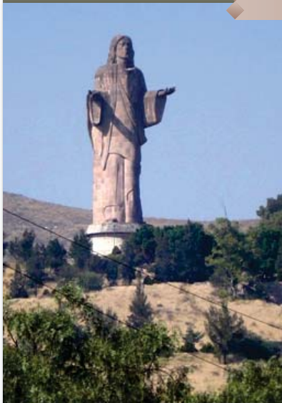
Cristo de Tlalnepantla