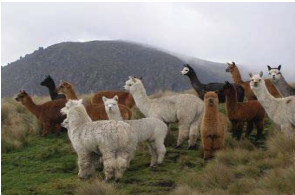
La alpaca y la vicuña, son dos grandes recursos económicos para Perú

El Perú es un país con una fauna muy variada, que incluye miles de especies, muchas de ellas endémicas y poco conocidas. Los principales grupos de especies son los mamíferos (460 especies), aves (1.723 especies), reptiles (297 especies), anfibios (332 especies) y peces (1.600 especies).