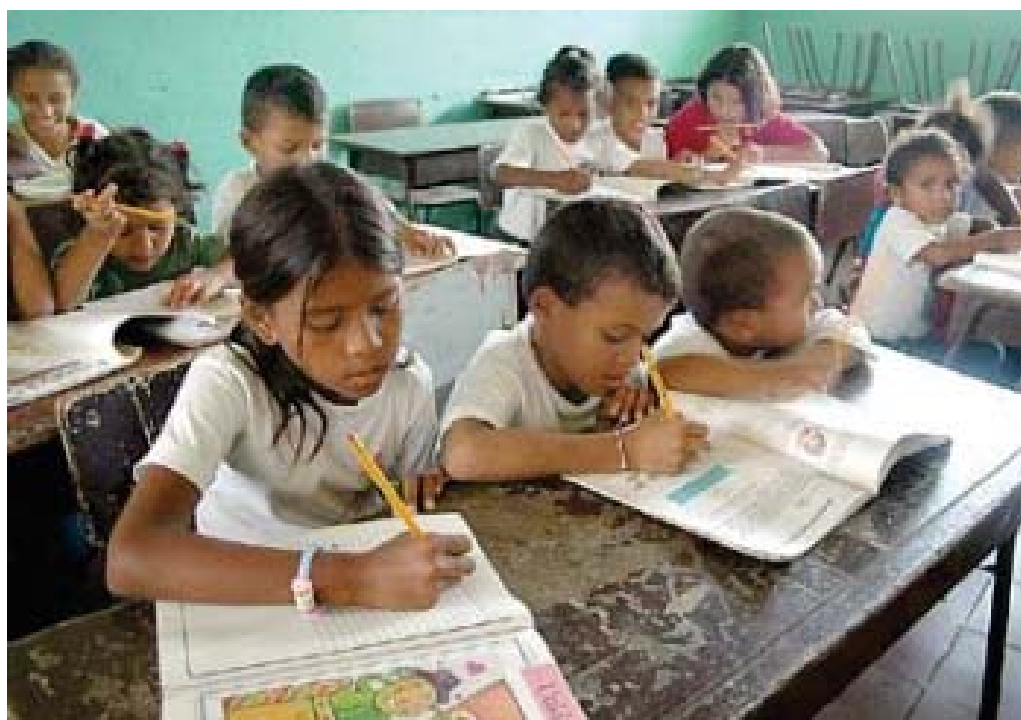
Los derechos educativos para toda la población es uno de los logros de la nueva constitución.

Otro de los temas que se menciona es el cultural, intentando salir del marginamiento y del olvido, ya que siempre constituye un elemento revolucionario y de avance. También se habla del tema del deporte y de la recreación.