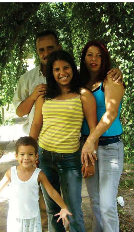
Los derechos de la familia aparecen por primera vez en la Constitución Apureense.