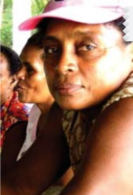
El Título XIII esta dedicado íntegramente a la mujer ratificando su igualdad en cuanto a sus derechos y deberes.

Dentro del texto constitucional se incorporan dentro de la parte de la educación algo totalmente imprescindible, tratándose de un estado en el cual la actividad deportiva debe constituirse en un modus vivendi .