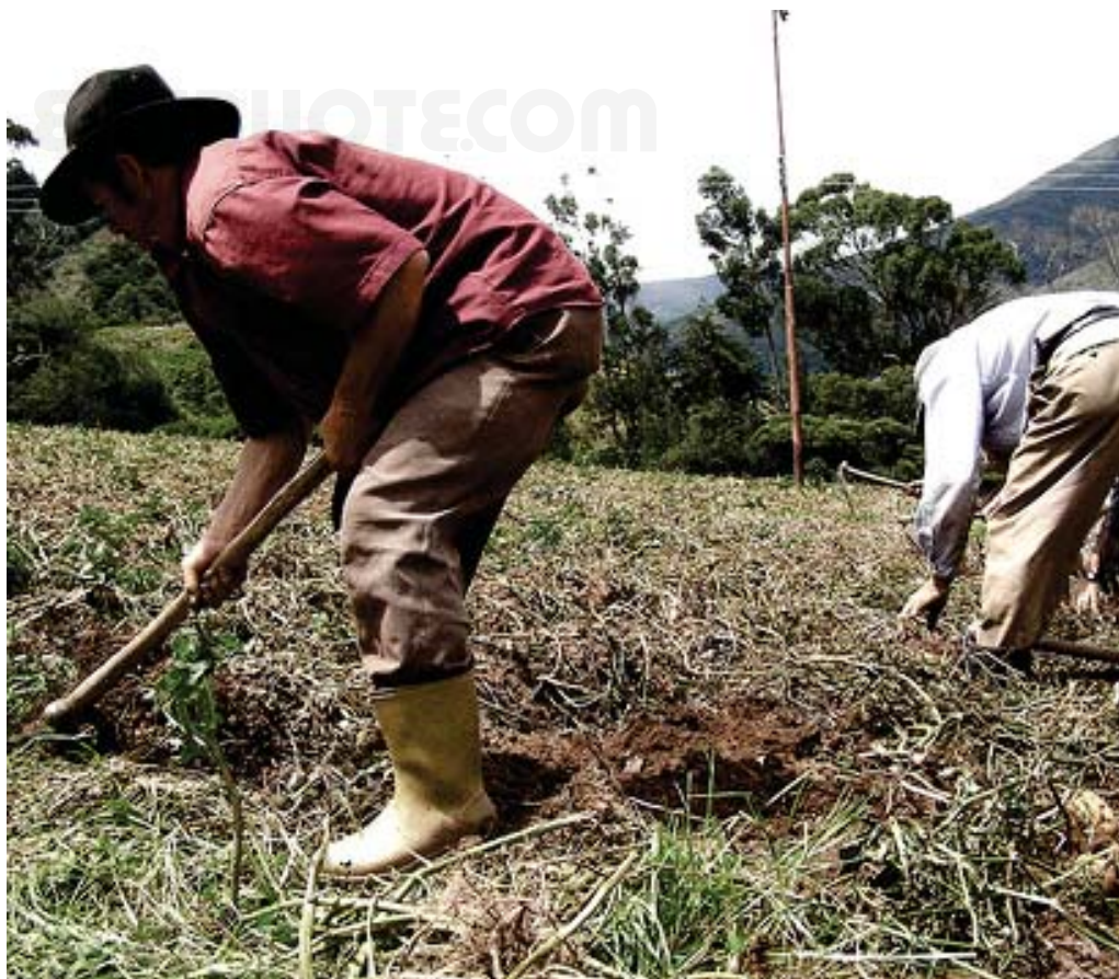
En el título X se establecen los poderes del ciudadano y de los trabajadores.

En el VIII se hace lo propio con el poder público Municipal ratificando la autonomía de los mismos y consagrando constitucionalmente el régimen político de los municipios y parroquias, la organización de los Municipios, la gestión municipal y materias concurrentes.