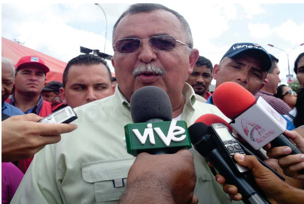
Ramón Carrizales gobernador actual del Estado de Apure.