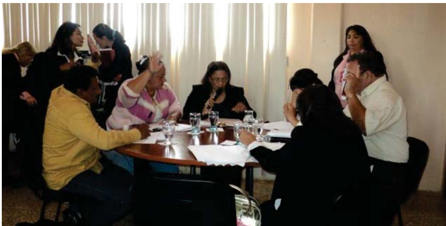
El Consejo Legislativo del Estado Apure debatiendo en la actualidad.

Este principio de autonomía no puede oponerse nunca al del la unidad nacional y estatal, antes bien, la autonomía solo adquiere sentido en esa unidad. Y a la unidad política y jurídica se le añade la unidad económica y por consiguiente, la unidad de mercado. Se establece un espacio económico homogéneo de circulación.