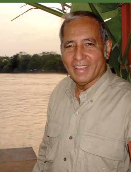
Jorge Rodríguez, Alcalde Mayor actual del distrito de alto Apure.

Los habitantes del distrito también eligen a un representante para los pueblos indígenas en el Cabildo Distrital del Alto Apure. En el año 2004 fue elegido el primer cabildo distrital, la mayor parte de sus concejales pertenecen al oficialismo. Luego en el 2008, el oficialismo volvió a conseguir la mayoría al obtener 5 de los 7 puestos.