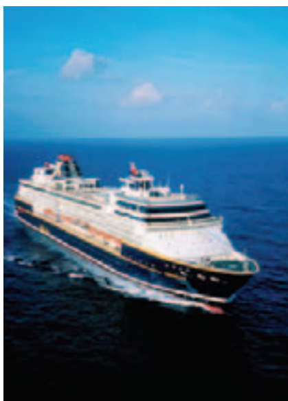
MUELLE ALMIRANTE STORNI En 1974 el Muelle Almirante Storni ya era una realidad. Ubicado en el fondo del golfo nuevo, uno de los más grandes, mejores puertos Naturales del mundo. Sus aguas protegidas hacen segura la permanencia de los Buques atracados o en los fondeaderos, considerados buenos tenedores.

La actividad pesquera es uno de los pilares fundamentales de la economía del Chubut. A la variada riqueza ictícola de sus aguas se suma una importante infraestructura de industrialización y procesamiento, instalada junto a sus terminales marítimas. Chubut una de las cinco provincias argentinas con litoral marítimo. Está experimentando un crecimiento sostenido en este sector, gracias a la modernización industrial y la incorporación de mano de obra especializada.