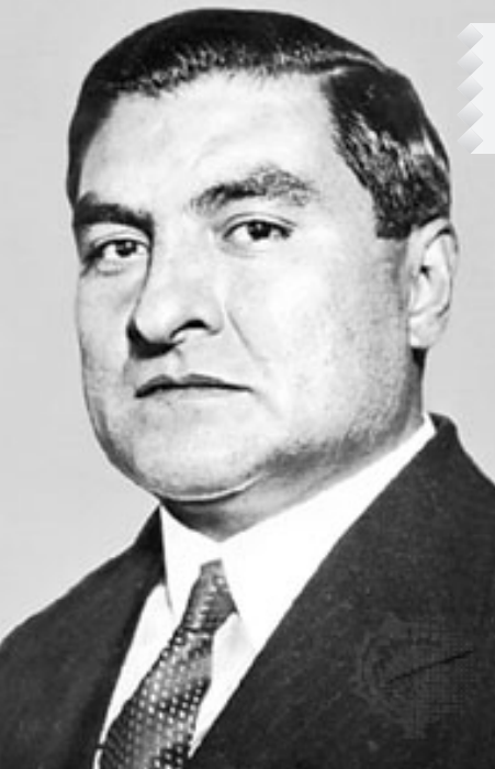
Emilio Portes Gil

En tanto que, en el campo, la situación era mucho más crítica, debido a que la ganadería sufrió el notable golpe que implicó el cierre de la exportación al mercado norteamericano. A su vez, la agricultura fue otro rumbo muy afectado en esa época, a raíz de la sequía de 1929, la cual disminuyó drásticamente la producción de granos, y del fuerte aumento que presentaron los precios, que hicieron que la recolección de las cosechas fuera económicamente imposible.