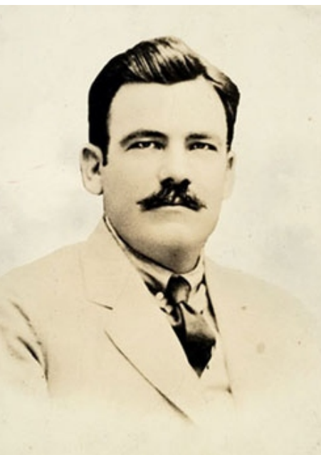
General Plutarco Calles

Anteriormente, en 1929, la denominada “rebelión renovadora” o “escobarista”, comandada por Gonzalo Escobar, se lanzó contra el Gobierno de la República. En el marco de esta ofensiva, el General Plutarco Calles impuso en la Presidencia al Lic. Emilio Portes Gil y a su sucesor el Ing. Pascual Ortiz Rubio.