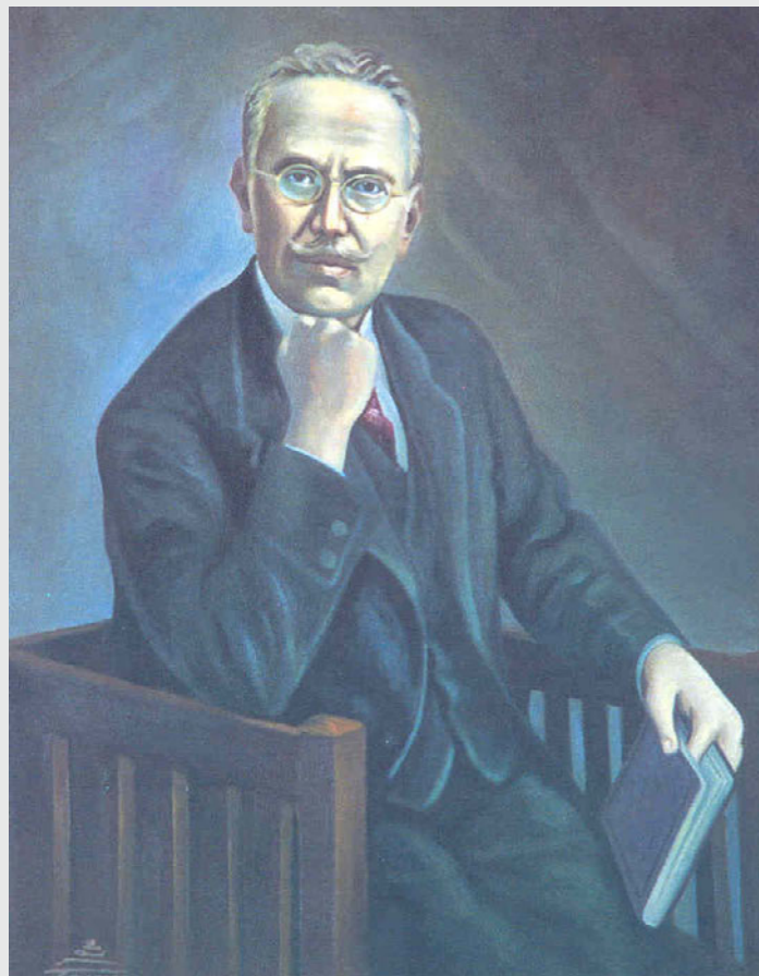
Pascual Ortiz Rubio