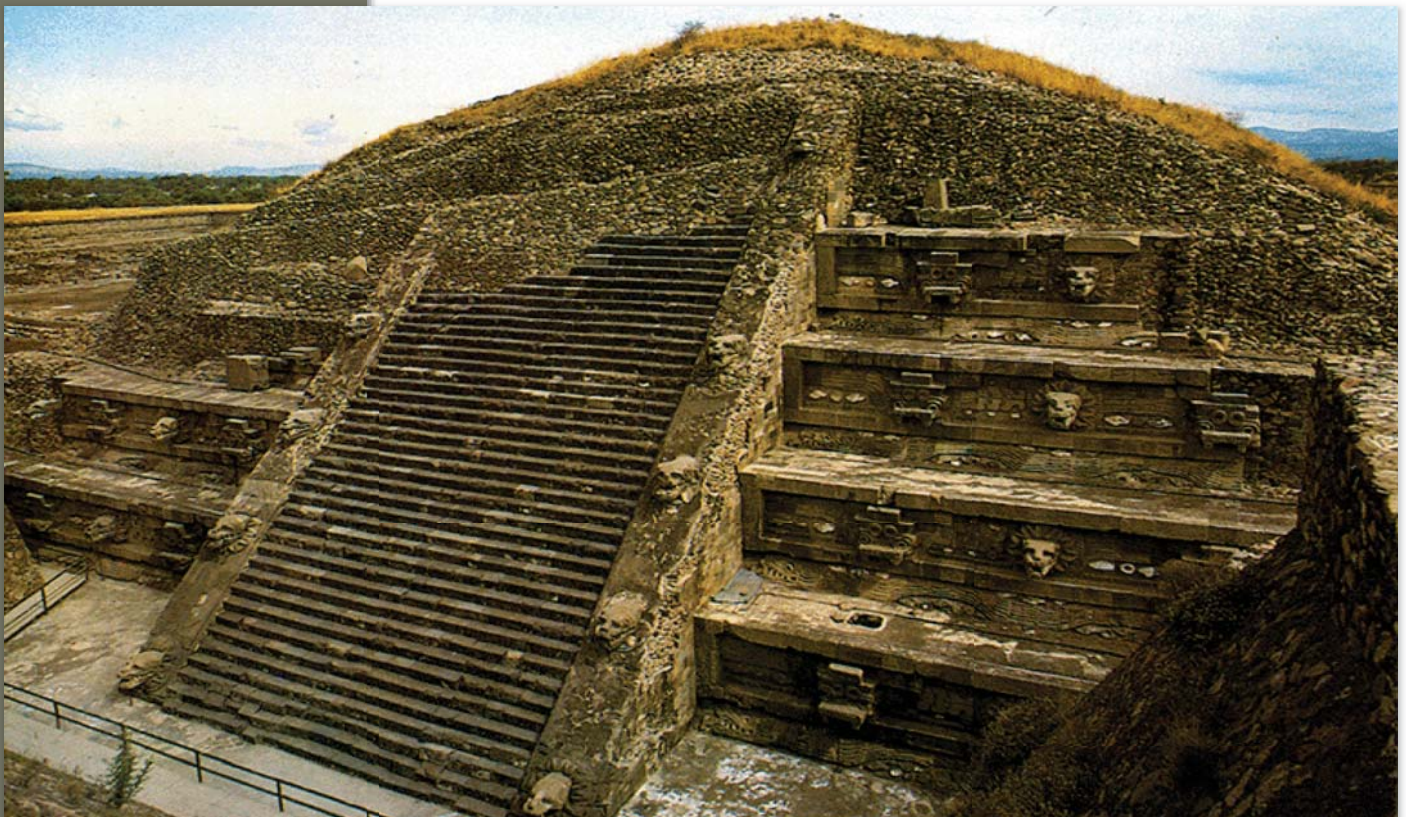
Ciudadela de Teotihuacan

Los investigadores suponen que fue la sede del gobierno de la ciudad. Se encuentra localizada en el extremo sur del centro ceremonial. Los estudios demostraron que la estructura fue construida alrededor del 200 a.C. en forma de cuadrángulo, con 400 metros de extensión. Aquí se resguardaron importantes edificaciones religiosas como el Templo de Quetzalcóatl, un adoratorio central y los conjuntos habitacionales donde se cree que vivían los altos dirigentes y sacerdotes.