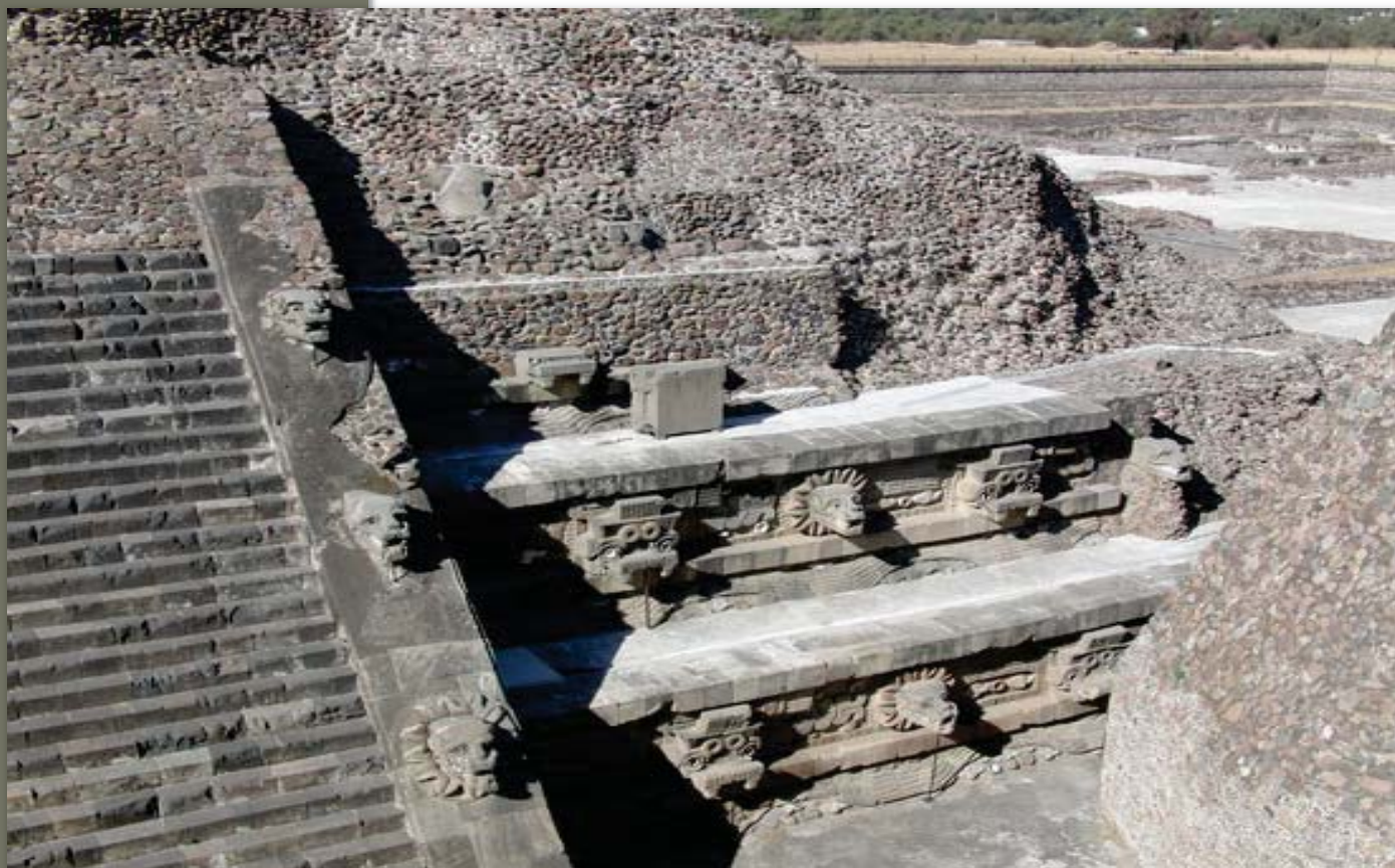
Templo de Quetzalcoatl

Se encuentra localizada en el extremo norte de la Calzada de los Muertos. Al igual que la Pirámide del Sol, fue construida entre los años 1-150 d.C., Consta de 40 metros de alto, sobre un área de 1,800 metros cuadrados en su base, en los que pueden observarse cuatro grandes cuerpos sobre los cuales se encuentra un gran templo adosado con un talud escalonado y un tablero. Las escaleras, orientadas al sur, están construidas en una estructura saliente, que no tiene la pirámide del Sol. Otros nueve cuerpos de inferior rodean a la plaza frente a la estructura.