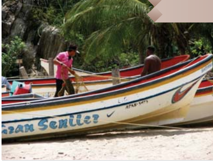
Pescadores de choroní.

Las principales actividades de sustento económico de esta localidad son la pesca y el cultivo de cacao. Así también, a partir del año 1990, momento en que se terminó de asfaltar su carretera, haciendo más simple poder llegar a la ciudad, la misma se convirtió en un excelente destino turístico, recibiendo cientos de visitantes los fines de semana y feriados.