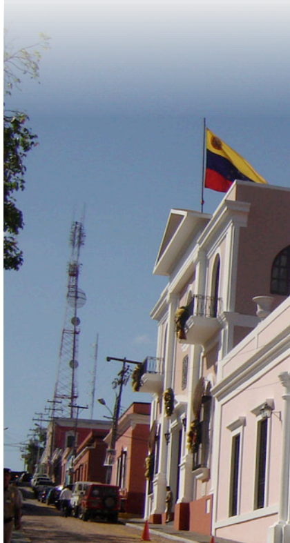
Casa del Congreso de Angostura.

La Catedral se encuentra ubicada en el sector oeste de la plaza, y fue comenzada a construir en 1771. Se encuentra dedicada a Nuestra Señora de las Nieves, por lo que cada 5 de agosto se realiza una ceremonia especial.