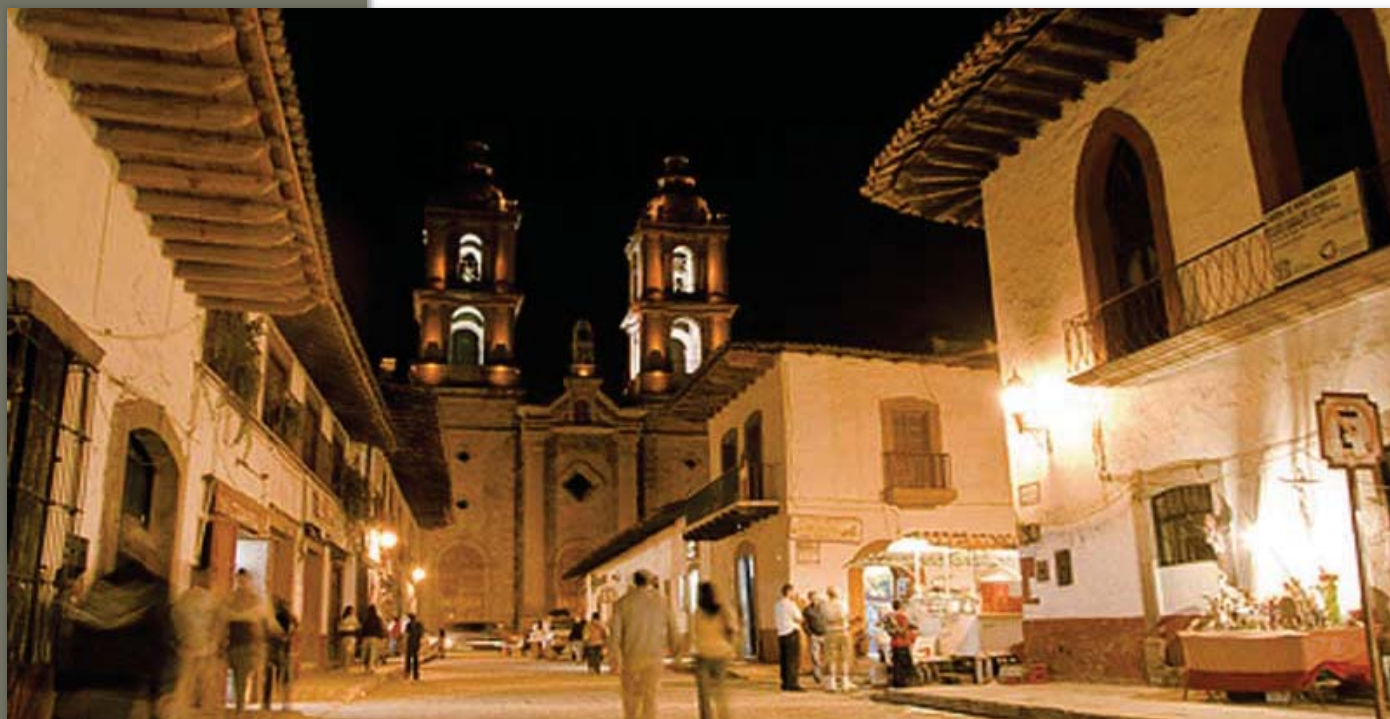
Centro de Valle de Bravo

Por otro lado, el Valle de Bravo también está cerca de hermosas reservas naturales. Una de las más importantes es el Santuario de la Mariposa Monarca donde puede apreciarse el maravilloso espectáculo migratorio de noviembre a marzo. Otro importante sitio es el Parque Natural Bosencheve o la Reserva de Monte Alto, lugares elegidos por las personas para practicar todo tipo de deportes de aventura entre los que se destacan el montañismo, escalada en roca, ciclismo, campismo y el vuelo libre en ala delta y parapente, estas últimas actividades extremas que, en los últimos años, han hecho que este poblado mexiquense se transformara en el destino favorito de los amantes de la adrenalina.