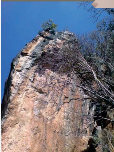
Peñon del Diablo, Valle de Bravo