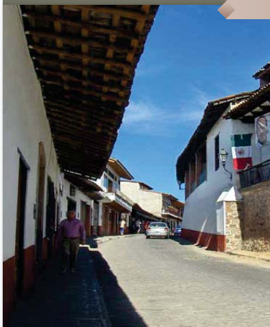
Típica calle de Valle de Bravo